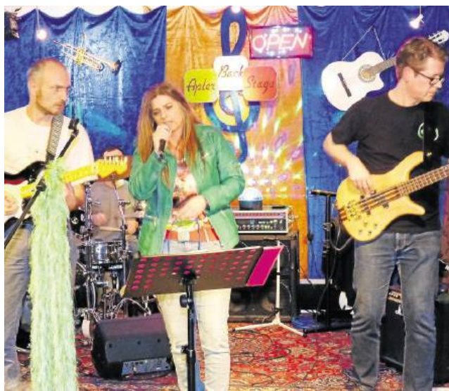
Die Band Frog Soup sorgte für Stimmung.