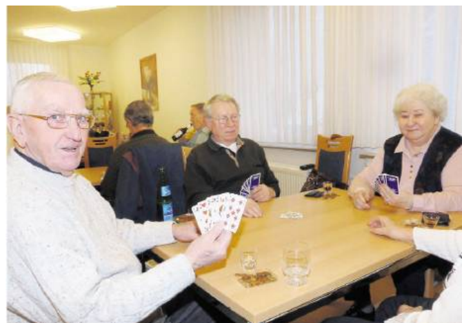
Die Arbeiterwohlfahrt (AWO) in Holzen hat einen Spielenachmittag in ihren Räumen angeboten. Am frühem Nachmittag kamen die Besucher zusammen um mit Austausch, Unterhaltungen und Kartenspielen den Tag zu verbringen.